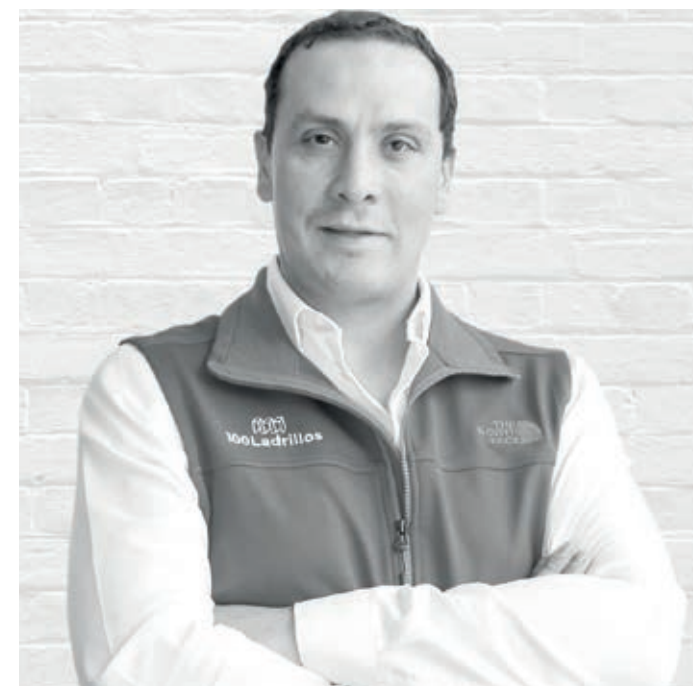
Actividades del sector

Eficiencia Operativa: Procesos automatizados reducen tiempos y costos, mejorando la eficiencia tanto para inversores como para desarrolladores.